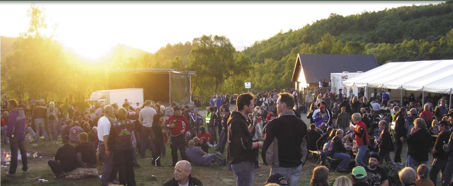
Treffplassen i Folkeparken i Harstad i strålende midnattsol

Flere av klubbens medlemmer ferierer hvert år i Europa. Det har blitt en tradisjon å kjøre hele Europa rundt for å nyte mil etter mil på sykkel i selskap med gode venner. Treffkjøring i Norge er selvfølgelig også en sak man forsøker å prioritere. Flere fra klubben har deltatt på Madonnatreffet i Italia. På FIM-rally i Edinburgh, Skottland i 1992 deltok 21 medlemmer fra HMC. Bikemeet i Sverige og Danmark har også vært besøkt.