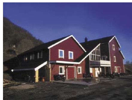
HMC må ha et av Norges flotteste klubbhuset - bygd på dugnad av klubbens medlemmer (!)

treffavgiften. Store navn som Stage Dolls, Wild Willys Gang, Omar & The Howlers og TNT pluss flere har alle gjestet treffet for å spille og underholde.