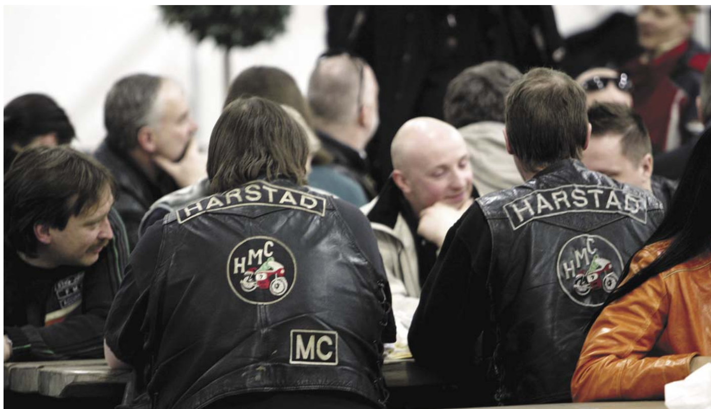
Fra klubbtur til MC-messa i Oslo i 2006