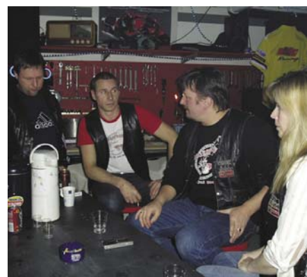
Fest i verkstedet på klubbhuset

Alle MC-folk er velkommen innom på klubben. Du finner folk der stort sett hver eneste dag gjennom hele året! Mer om både HMCs historie og det klubben opplever finnes det masse informasjon om på egne nettsider som ligger på www.harstadmc.no